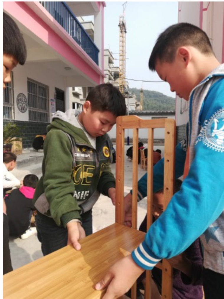
河南嵩县黄水庵小学：学生动手组装新书架