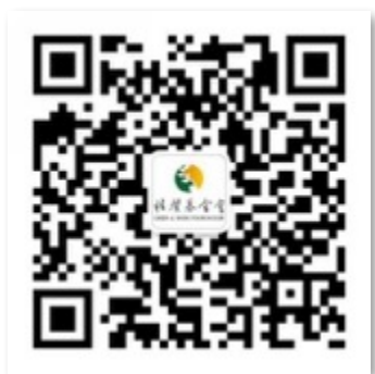
桂馨基金会微信公众号