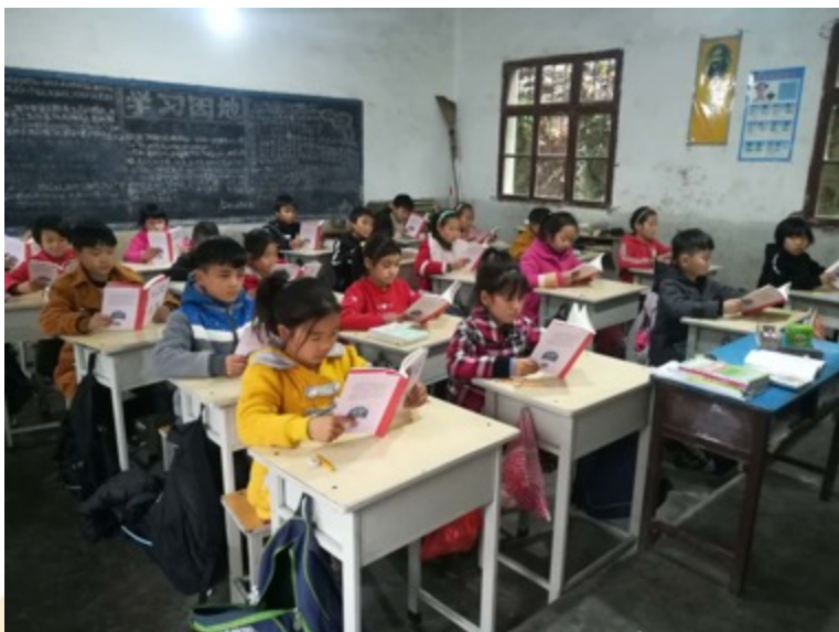
河南汝阳县玉马小学： 四年级共读《我和小 姐姐克拉拉》