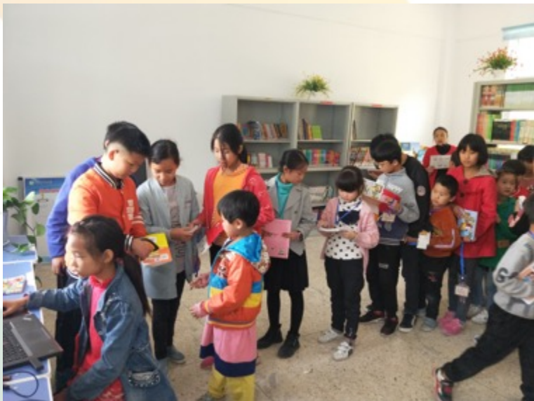
河南嵩县大坪小学： 电子借阅系统的建设， 大大提高了借阅效率