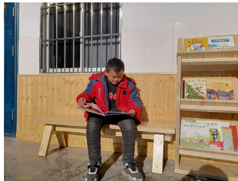
悦读空间的室外延伸