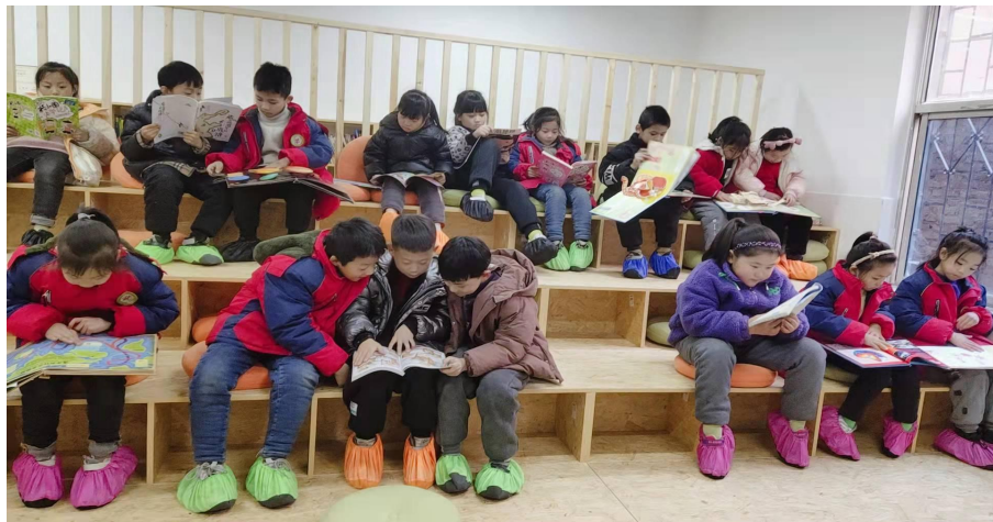
孩子们在悦读空间里看书