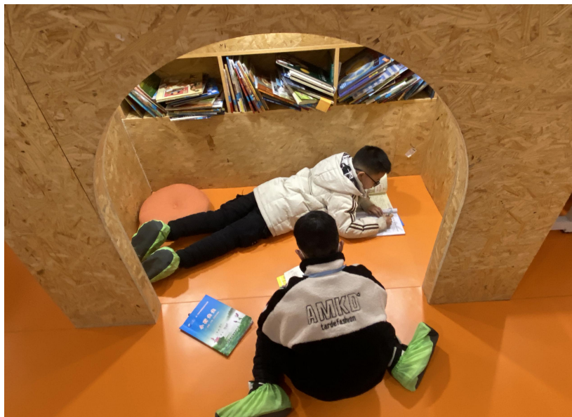
学校最喜欢的小角落